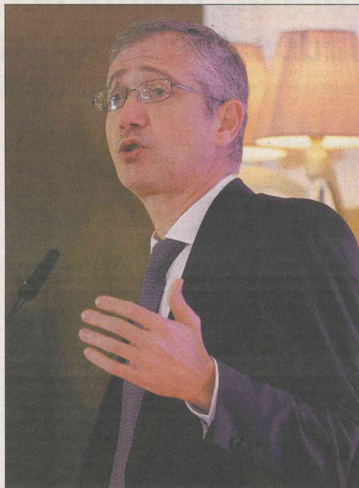
El gobernador del Banco de España, Pablo Hernández de Cos.

La deuda consolidada de las sociedades no financieras se redujo